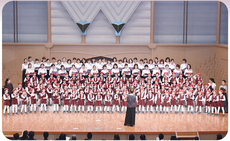
唱歌・童謡コンサート in 泉の森 (2015年1月17日)