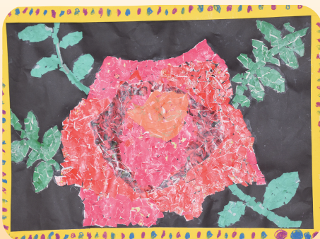
包装紙 使って細かく ていねいに 安松幼稚園 5才児 作 ちぎり絵「ばら」